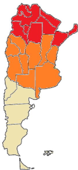
Gráfico 3. Proporción de los beneficiarios del IFE en relación a la población entre 18 y 64 años.

También la proporción de los beneficiarios del IFE en relación a la población entre 18 y 64 años presenta disparidades según la región. Las regiones del norte argentino, cuyos indicadores sociales muestran mayor número de personas en condiciones de vulnerabilidad, son las que concentran la mayor proporción de beneficiarios del IFE en relación a su población entre 18 y 64 años. La contracara de ello son la Ciudad Autónoma de Buenos Aires (CABA) y la región Patagónica que presentan una proporción de estos que es inferior a la del promedio nacional.